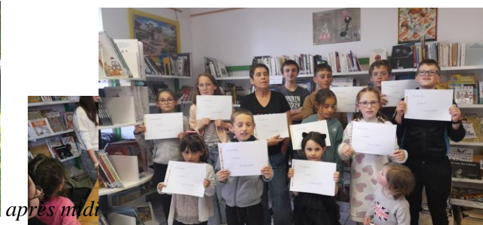
atelier écriture et dessin