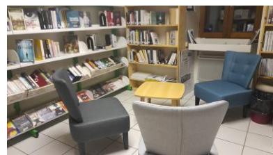
notre petit salon